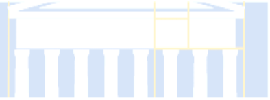
Figura 1. Instrumento de evaluación